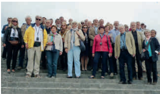
Die Reisegruppe des Absolventenverbandes

Es ist zweifellos so, dass Schönwetter jede Reise begünstigt: und davon hatten wir 42 Teilnehmer an der Reise des Absolventenverbandes nach Paris und in die Normandie reichlich. Ein Tag war schöner als der andere.