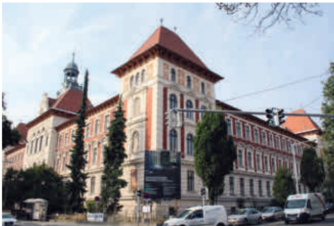
Das Gregor Mendel Haus: Die Ampeln für den größten Umbau in der 140-jährigen Geschichte der BOKU stehen auf grün. Ein Teil der 900 Fenster wurde bereits ausgetauscht.

Ein barrierefreier Zugang zur BOKU ist eine der wichtigsten Maßnahmen im Zuge der Sanierungsarbeiten. Dazu wird auf der rechten Seite direkt neben dem Haupteingang ein Loch in die Fassade gestemmt. Im Innenhof entsteht ein zusätzlicher Aufzug, der das Erdgeschoss, die Zwischenebene sowie die weiteren zwei Stockwerke und das Dachgeschoss barrierefrei verbindet. Der beliebte Innenhofstand, seit über vielen Jahren Treffpunkt für Mitarbeiter/innen und Studierende, hatte nur eine befristete Bewilligung und wurde bereits abgerissen, erhält aber gleich ein paar Meter nebenan eine zeitgemäße Infrastruktur zur Verfügung gestellt. Auch brandschutztechnisch sind umfangreiche Maßnahmen erforderlich. So entsteht zusätzlich zur Hauptstiege ein weiteres Stiegenhaus, um neue Fluchtwege zu schaffen.