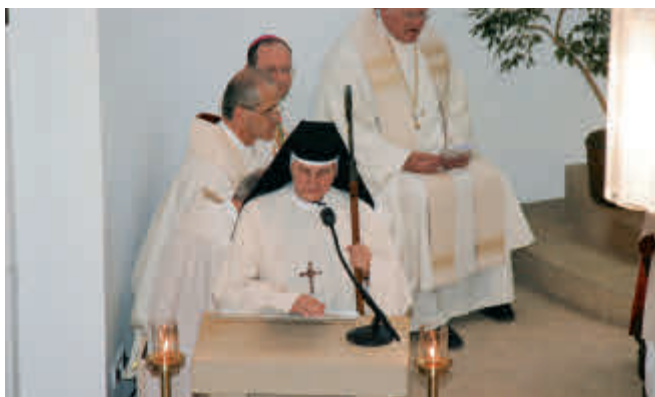
Benediction am 11.7.2014 in Marienfeld