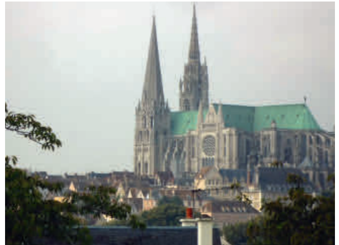
Kathedrale in Chartres

zunehmen. Beeindruckt von der Kathedrale, die in den Rosenkriegen verschont worden war und auch die Revolution unbeschadet überstanden hatte, bewunderten wir die wunderschönen Kirchenfenster, die sowohl 1918 als auch 1939 abgebaut worden waren und so vor einer kriegsbedingten Zerstörung bewahrt werden konnten. Die Kathedrale – wie wir sie heute sehen – wurde in Teilen ab 1134 erbaut und immer wieder erweitert und umgebaut.