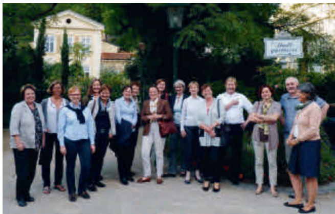
Der Kurpark Baden

Was ich schon damals so geschätzt habe, konnte ich auch beim Zusammensein nach 35 Jahren wieder deutlich spüren: Auf der Boku begegnet man einfach besonders lieben Menschen! Und so möchte ich allen ganz herzlich danken, die unser Treffen angeregt, organisiert und durchgeführt haben. Sogar aus Kärnten, der Steiermark und Oberösterreich sind die Kolleginnen und Kollegen angereist und die Wiedersehensfreude war bei allen sehr groß.