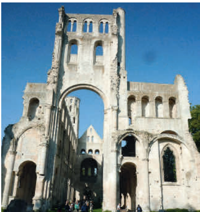
Die Abtei von Jumieges

Besonders beeindruckt hat uns am nächsten Tag die Besichtigung der Ruinen der Abtei von Jumieges . Im 10. Jhdt. errichtet, wurde sie während der französischen Revolution gesprengt und deren Steine als Baumaterial in der Umgebung verwendet. Die Mauern der ursprünglich 88 m langen und 25 m hohen Kirche ragen nun beeindruckend in den Himmel. Die Abtei diente übrigens viele Jahrhunderte später als Schauplatz für einen „Arsene Lupin-Film“.