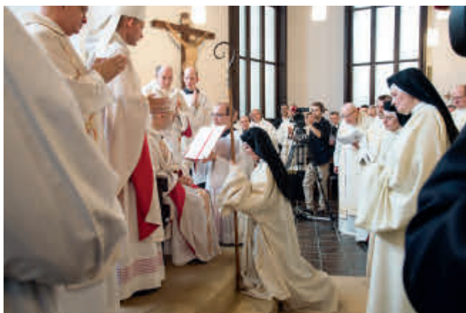
Benediction am 11.7.2014 in Marienfeld

Kollegen aus dem Inskriptionsjahrgang 1966 (bzw. auch angrenzenden Semestern) v.a. durch Briefe bzw. e-Mail. Auch das „Agrarjournal“ liest sie – wie sie uns versichert – regelmäßig und hält auch so ihre Verbindung mit der BOKU aufrecht.