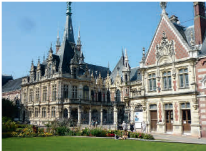
Fecamp – „Benedictine“

Weiter ging es, der sich mäandernden Seine entlang, vorbei an der Hafenstadt Le Havre in das Seebad Etretat , wo sich viele an einem „Sea-Food“-Mittagessen erfreuten. Der Ort ist vor allem berühmt für seine kalkbleichen Steilklippen aus denen der Wind und das Meer majestätische Bögen mit grandiosen Durchblicken herausgewaschen haben. In dem kleinen Fischerstädtchen Fecamp hatten wir Gelegenheit die Produktionsstätte des Likörs „Benedictine“ zu sehen und bei einer (sehr sparsamen) Verkostung des Likörs diesen auch zu genießen.