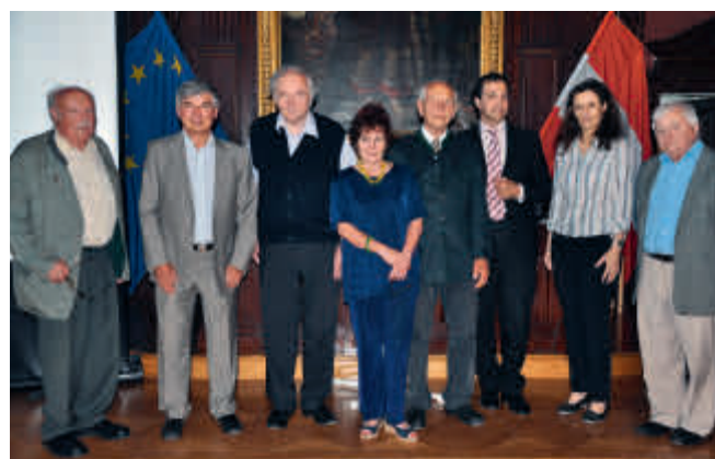
CAS-Team und Sponsoren

Die Gregor-Mendel-Gesellschaft Wien hat wesentlich zum Gelingen dieser Veranstaltung beigetragen und ihr einen feierlichen Rahmen beschert. Sie hat zudem, zusammen mit mehreren Firmen, auch Preise gesponsert, wofür wir uns herzlich bedanken möchten!