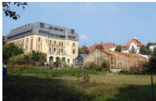
Im Simonyhaus stehen der BOKU rund 550 m 2 zusätzliche Fläche zur Verfügung. Im Vordergrund steht noch das alte Forschungsglashaus.

Der Ausbau des Dachgeschosses im Simonyhaus wurde nach zwei Jahren Bauzeit Mitte August fertiggestellt. Damit stehen der BOKU rund 550 m 2 zusätzliche und dringend benötigte Fläche zur Verfügung. Für den BOKU-Kindergarten wartet man noch auf die Baubewilligung, dann kann der Neubau sofort starten. Gebaut wird ein neues zweigeschossiges Gebäude mit Keller zwischen den Glashäusern und dem Simonyhaus, die Ausschreibung der BIG läuft bereits. Hinein kommt ein Kindergarten, straßenseitig zieht das Institut für Botanik, als Ersatz für das kleine graue Gebäude daneben, ein. Die Erneuerung des Forschungsglashauses wird spätestens im Jänner 2015 fertig gestellt und bietet dann wesentlich mehr Effizienz. Die Sanierung des Standortes Jedlersdorf ist zum Teil bereits fertig. Der Gebäudekomplex wurde ebenso rundum erneuert. Früher waren dort Dienstwohnungen, heute finden sich Seminarräume, Büros und eine moderne Hackschnitzelanlage sowie Solarheizungen. Das Institut für Obst und Gemüsebau bleibt dort erhalten. In Groß Enzersdorf werden etwa 600 m 2 renoviert, die Sanierung war schon seit längerer Zeit überfällig. Die Außenstelle Ebling wird im kommenden Jahr aufgegeben. Die dort ansässigen Institute ziehen nach Groß Enzersdorf. Auch am Standort Tulln werden weitere Bautätigkeiten zur Schaffung von modernen Labor- und Büroflächen umgesetzt.