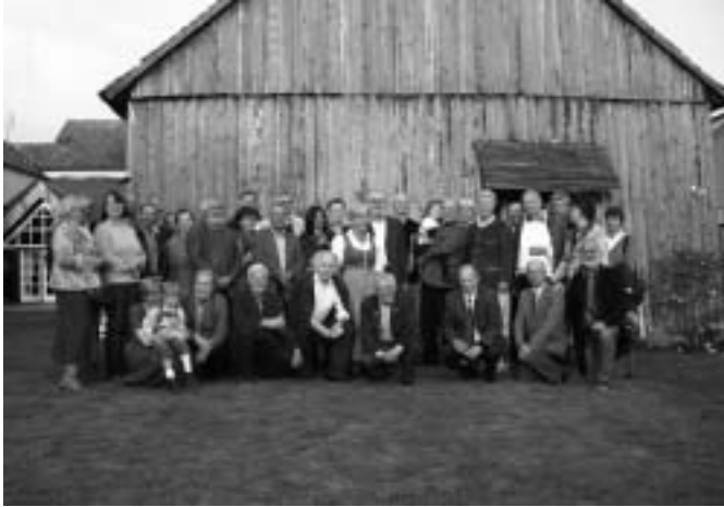
Die H-66er in Radlbrunn

die Heimstätte der Niederösterreichischen Volkskultur und regionale Begegnungsstätte.