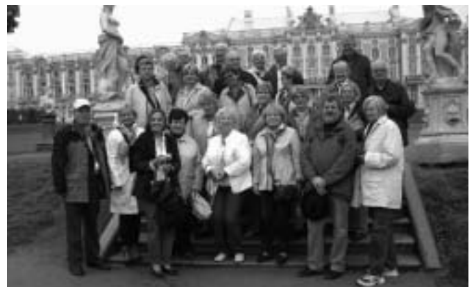
Die lustige und interessierte Reisegruppe

Der 3. Tag war der beeindruckenden Stadt Petersburg mit an die 3 Millionen Einwohner mit einer Stadtrundfahrt und der Besichtigung der Festung Peter & Paul gewidmet. Zar Peter der Große hat die Festungsstadt dem sumpfigen Lehm Boden abgerungen. Es gab auch eine Fahrt nach Zarendorf oder auch Puschkin an den südlichen Stadtrand. Dort besichtigten wir den Katharinenpalast mit dem berühmten rekonstruierten Bernsteinzimmer.