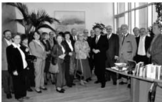
Im Büro des Landeshauptmanns

Mit zunehmendem Alter der Teilnehmer verdichtet sich die Frequenz der Semestertreffen. Hatten wir uns nach Absolvierung des Studiums (mit zum Teil stark divergierenden Sponsionsterminen) jahrelang nicht (außerberuflich) gesehen, so kommen wir nun, wo schon ein guter Teil der Kollegen in Pension ist, nahezu jährlich zusammen.