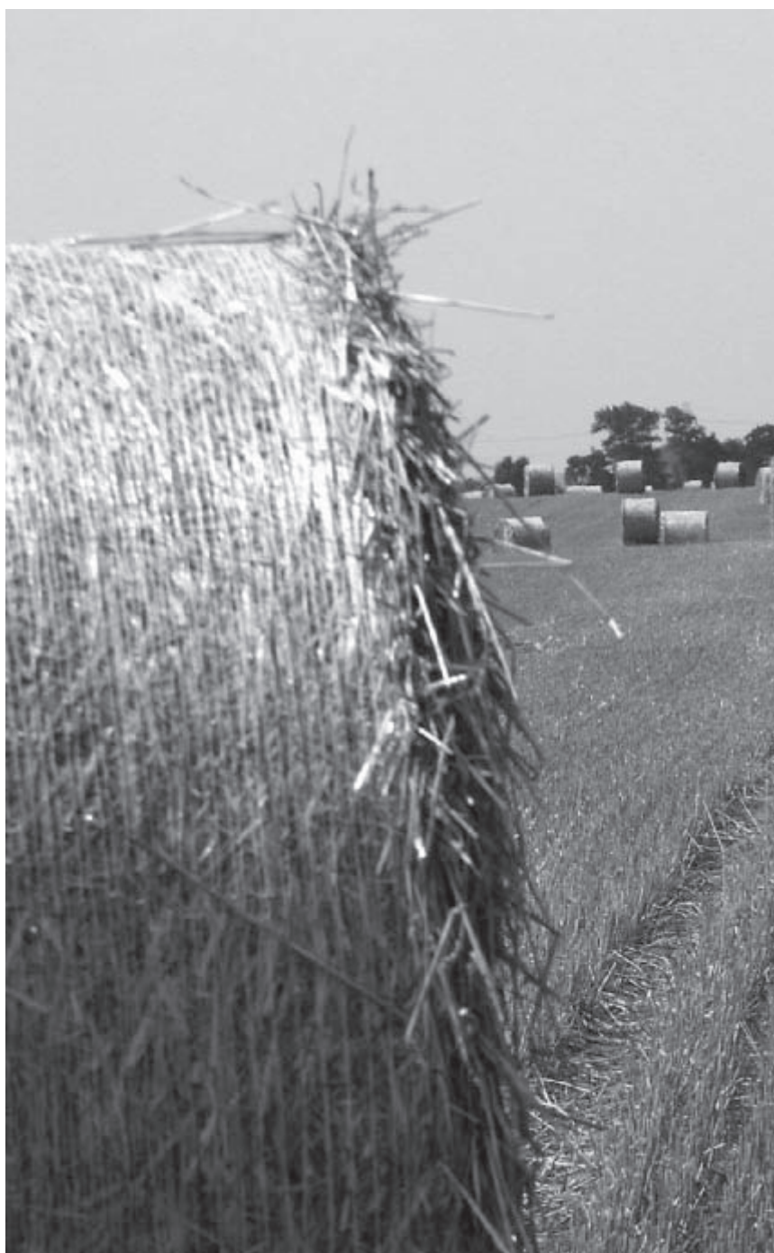
Rundballen auf abgeerntetem Feld